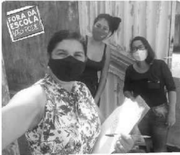
Busca Ativa - Conj. André Alves