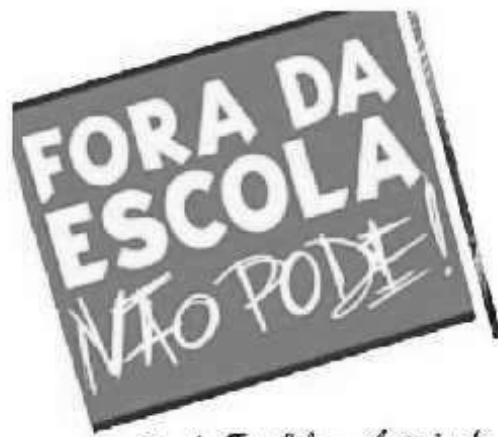
Creche Tia. Lili em Ação junto na Busca Ativa - 2021